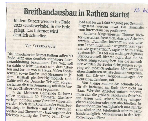
Regionalzeitung SZ berichtet in der samstags Ausgabe