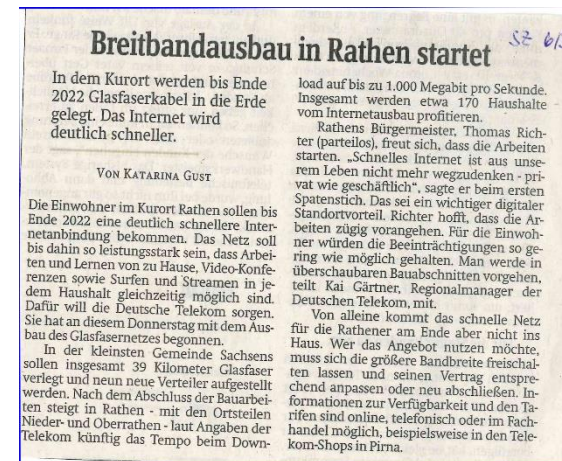
Regionalzeitung SZ berichtet in der samstags Ausgabe